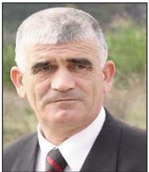
Shkruan: Kudusi LAMA

Që të kuptojmë se çfarë kanë thënë serbët kundër Ushtrisë Çlirimtare të Kosovës paraprakisht duhet të kuptojmë mirë veprimet serbe kundër dhe ndaj Kosovës duke mbajtur në vëmendje se, në këtë vend, pra në trojet e pushtuara edhe në hapësirat e Kosovës, ajo ka bërë një luftë të ashpër prej një shekulli, duke vënë në jetë parime të paimagjinueshme kundërnjerëzore që njihen, por duhet të përsëriten.