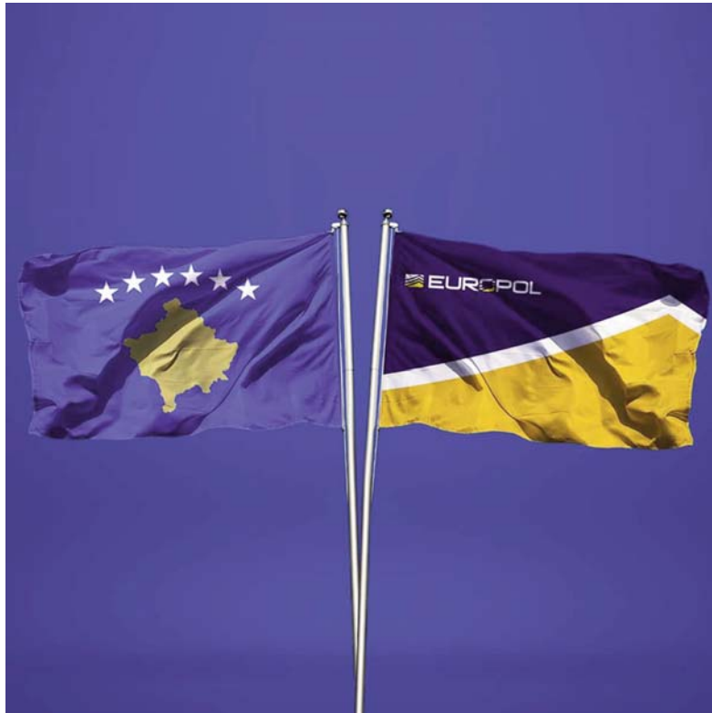
tjerë nga institucione vendore e ndërkombëtare.

Me rastin e nënshkrimit të marrëveshjes së bashkëpunimit me EUROPOL-in, ministri i Punëve të Brendshme, Agim Veliu, ka theksuar se sot është një ditë tejet me rëndësi për Republikën e Kosovës dhe agjencitë e zbatimit të ligjit, veçanërisht Policinë e Kosovës, marrë parasysh se me nënshkrimin e marrëveshjes me EUROPOL-in, vendi ynë ka forcuar dhe avancuar kapacitetet në parandalimin dhe luftimin e krimit të organizuar ndërkombëtar, terrorizmit dhe formave të tjera të krimit të rëndë. Pritet që shumë shpejt të dërgohet zyrtari ndërlidhës nga Policia e Kosovës në selinë qendrore të EUROPOL-it në Hagë