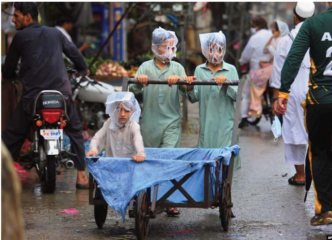
Disa djem në Pakistan mbulojnë kokën me qese najloni për t'u mbrojtur nga shiu.