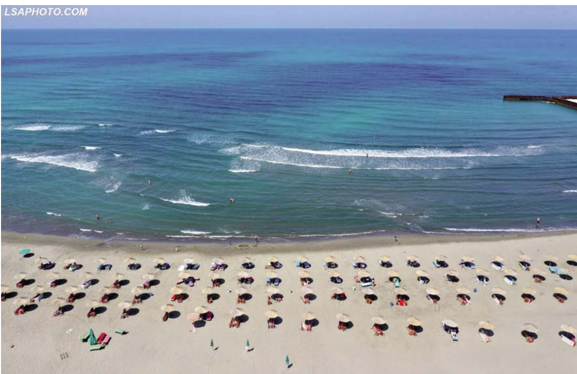
Pamje nga plazhi i Semanit, duke respektuar distancën kundër Covid-19