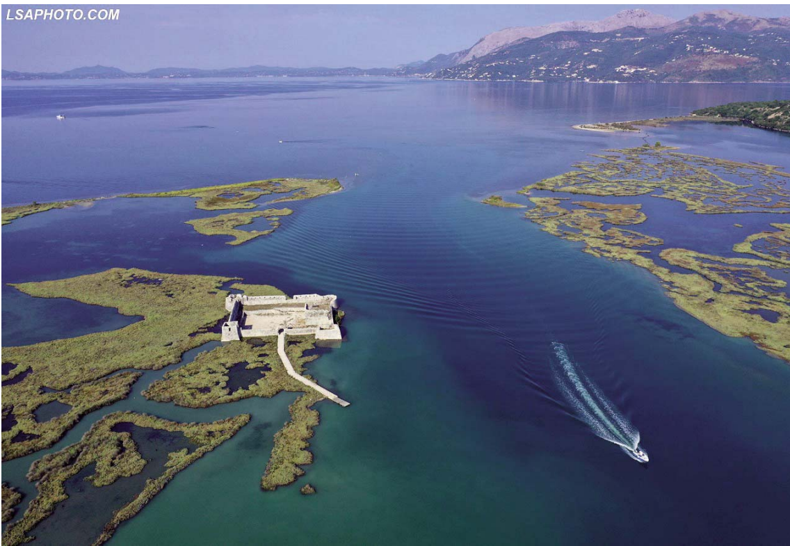
Pamje nga Kalaja e Ali Pashë Tepelenës, burim historik dhe trashëgimi kulturore shqiptare.