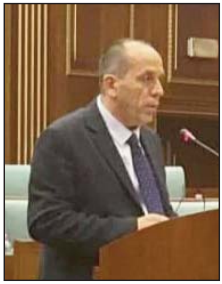
Shkruan: Ferat SHALA

Zgjedhjet e fundit parlamentare në Kosovë, ndër të tjera, janë karakterizuar nga një qëndrim pothuajse i të gjitha partive politike për të mos bërë koalicion me PDK-në. Ky qëndrim u artikulua zëshëm gjatë gjithë fushatës zgjedhor, por edhe pas përfundimit të