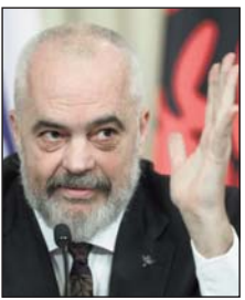
Shkruan: Edi RAMA