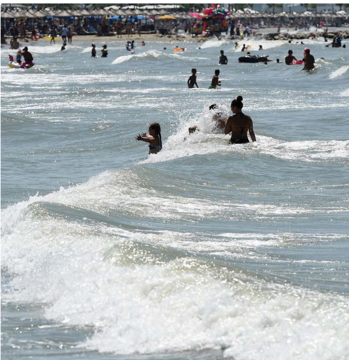
Deti me dallgë nuk ndal pushuesit në Malin e Robit.