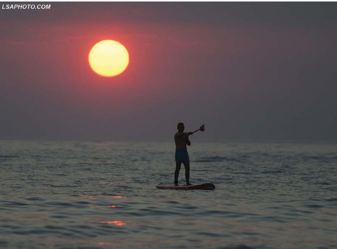
Një nga çastet më fantastike të perëndimit të diellit në Golem.