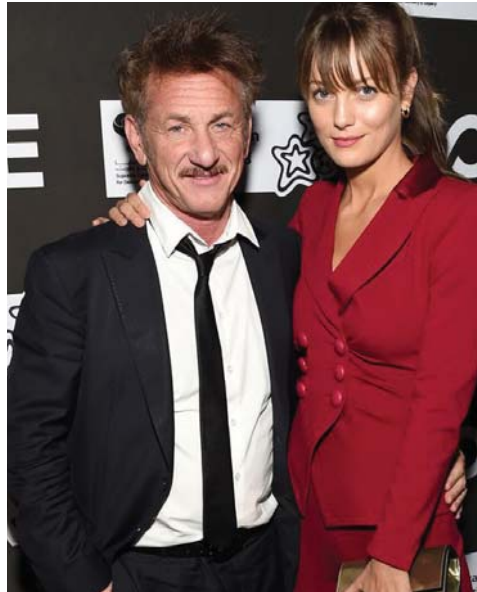
divorcoheshin në vitin 2010. Sean ka qenë, po ashtu, i lidhur me aktoren Charlize Theron nga 2013 deri në 2015.