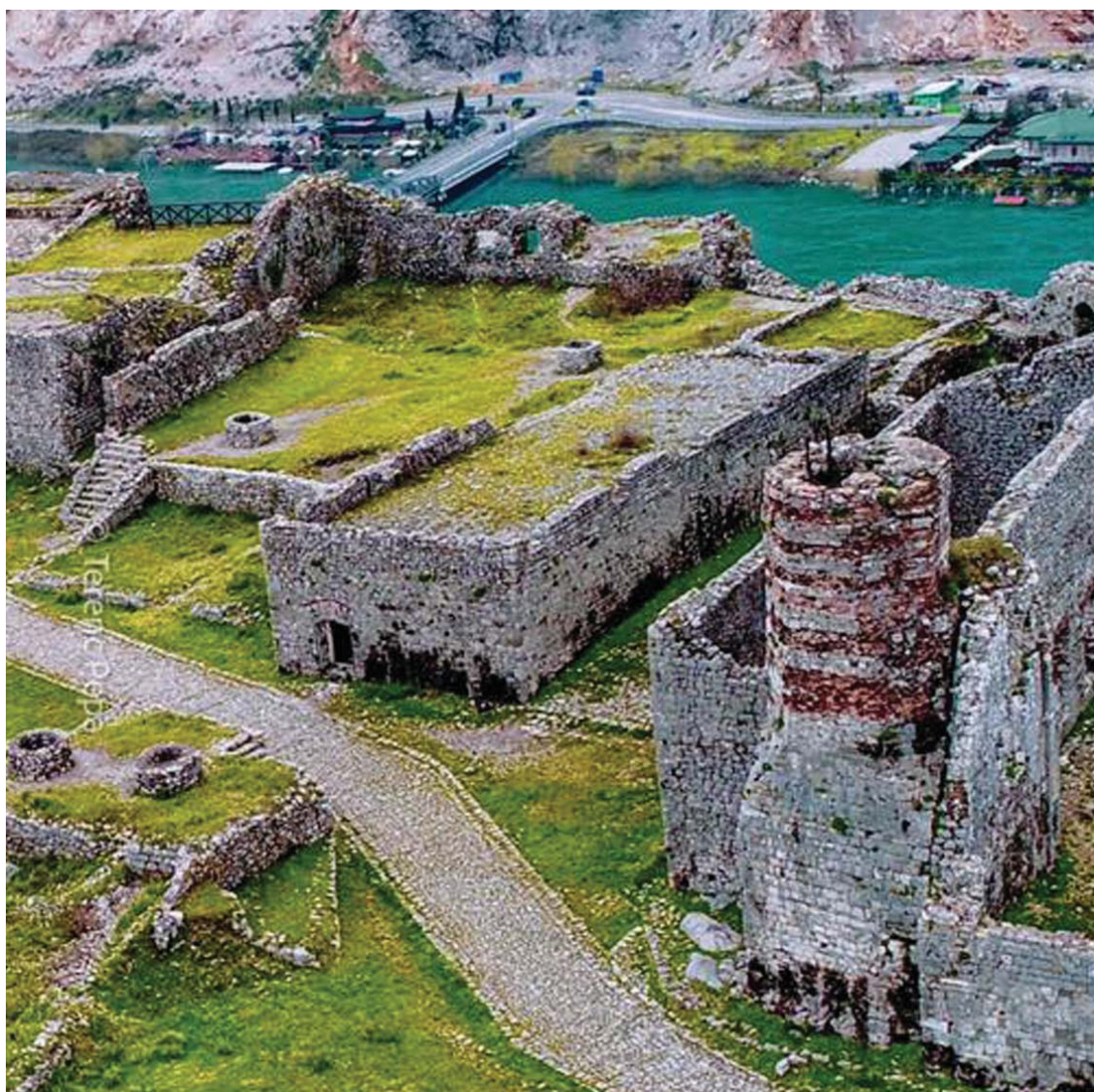
Pamje nga Kalaja e Rozafës në Shqipëri