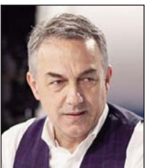
Shkruan: Faton ABDULLAHU

UÇK-ja është vlerë e qytetërimit evropian. Në të vërtetë, UÇK-ja është margaritar i qytetërimit perëndimor në përgjithësi. A kam të drejtë të konstatoj kështu?