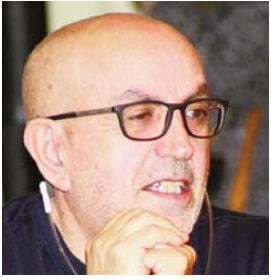
Shkruan: Behxhet Sh. SHALA - BAJGORA