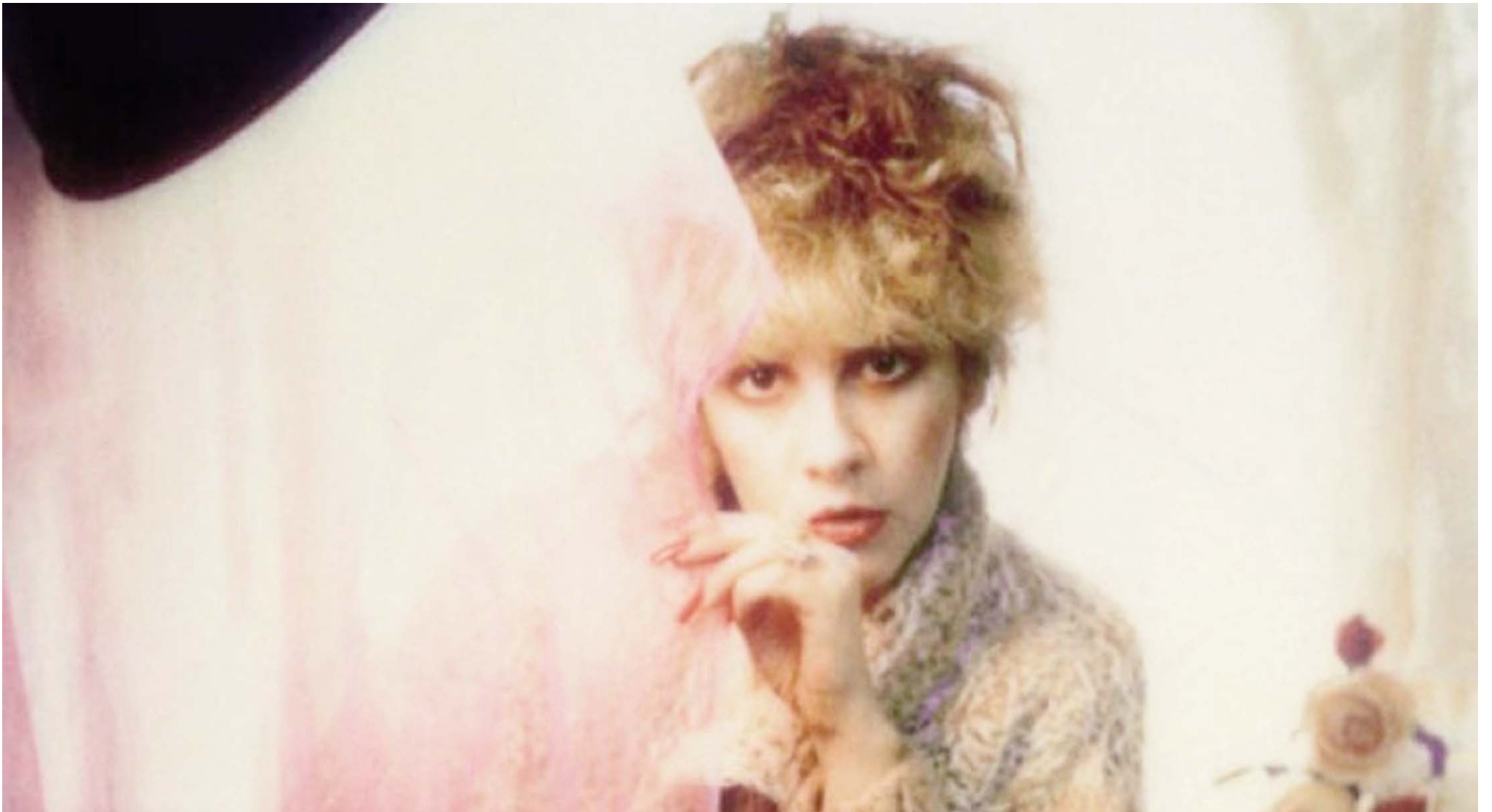
Stevie Nicks më 1985