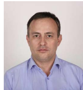
Shkruan: Fehmi RAMA

- ShBA-ja, superfuqia e vetme ruajtëse dhe garantuese e paqes dhe rendit botëror