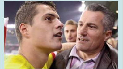
Disa herë këta ekspertë provokojnë me komentet e tyre, ka thënë Xhaka.

situatë, për të ditur se si ndihet një refugjat politik që është i ri në moshë. Pa dyshim që është pjesë e karakterit tim tani që të jem një person i fortë. Nuk kam ikur kurrë nga asgjë. Ka pasur komente nga Evra dhe Henry. Ata flasin për lojtarë të caktuar.