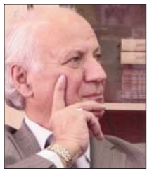
Shkruan: Bedri ISLAMI

Pas afishimit të qëndrimit të shtetit shqiptar, në Kosovë, pa mëdyshje, kemi dy tablo të ndryshme. Nga njëra anë është ndjenja e madhe e lehtësimit dhe e ripërtëritjes që përshkoi demonstruesit, sidomos të burgosurit politikë, ndërsa nga ana tjetër egërsia e mekanizmave shtetërore. I gjithë mekanizmi i stërmadh titist, në gjashtë republika dhe në dy krahina, u vu në lëvizje. Nuk duhet harruar se ky mekanizëm kishte, asokohe, mbështetje jo të paktë. Jugosllavia e pas Titos, ndonëse e çalë, ende kishte një vello, që kur do t'i hiqej plotësisht, do të dilte në pah gjakimi që ndodhi. Asnjë krijesë e sajuar shtetesh dhe e mbështetur aq verbërisht nuk do të kishte një fund aq të përgjakshëm sa Jugosllavia e Titos. "Plaku", si e quanin asaj kohe, kishte mbajtur vendin nën vete por, ndër kohë, nacionalizmat kishin mprehur thikat. Shqiptarët nuk do të duhej të bëheshin kurban i këtij gjakimi; në fillimin e gjithçkaje për të ishte e rëndësishme të dihej se, edhe në një moment pashmangshmërisht të vështirë të ardhshëm, do të kishin një mbështetje nga shteti shqiptar.