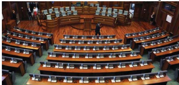
Sot (e hënë) mbahet seanca konstituive e legjislaturës së tetë të Kuvendit