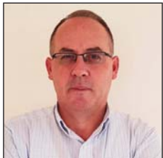
Shkruan: Lul RAKA

Mikrobet janë pjesë e pandarë e jetës sonë. Në trupin tonë kemi dhjetë herë më shumë mikrobe sesa qeliza tonat. Nga certifikatat e tyre të lindjes, bakteret kanë moshë miliardëshe, kurse viruset nja 300 milionëshe. Janë këtu denbabaden shumë para nesh duke na rikujtuar se pandemitë kanë qenë dhe do të jenë pjesë përbërëse e njerëzimit. Madje, ato kanë qenë rregull, dhe jo përjashtim.