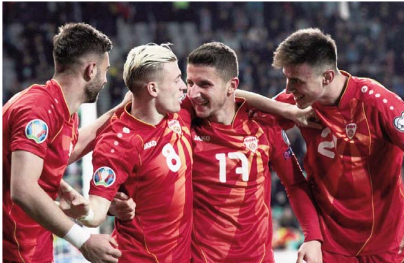
Lista e futbollistëve: