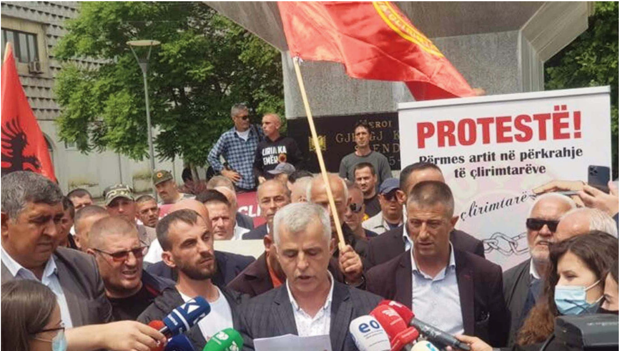
PROTESTOHET NË PRISHTINË NË PËRKRAHJE TË ÇLIRIMTARËVE QË GJENDEN PADREJTËSISHT NË DHOMAT E SPECIALIZUARA NË HAGË