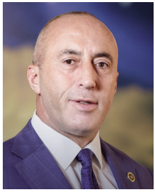
Shkruan: Ramush HARADINAJ

As unë nuk e kam besuar që për një kohë aq të shkurtër të vinte në pah gabimi strategjik i qeverisë Kurti për anulimin e projektit Kosova e Re në maj të 2020-s i nënshkruar me kompaninë Amerikane Contour Global. Kur ne kemi nënshkruar