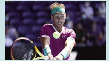
(numri 7 në botë), që mundi 3-1 amerikanin Brandon Nakashima.

zvicëria Belinda Benčić. Ka nisur me fitore aventura në Australian Open e tenistit spanjoll Rafael Nadal, që mundi me rezultat 3-0 amerikanin Marcos Giron (6-1, 6-4, 6-2). Më tej shkon edhe italianin Matteo Berrettini