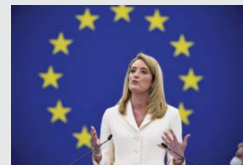
banorët e BE-së dhe e quan veten "zemër të demokracisë evropiane".

për t'i ulur njerëzit në një tavolinë. Është zotimi për t'i mbajtur së bashku forcat konstruktive në Evropë që unë do të punoj", tha ajo. Parlamenti Evropian vitet e fundit është bërë institucion edhe më i fuqishëm brenda bllokut evropian. PE-ja përfaqëson 450 milionë