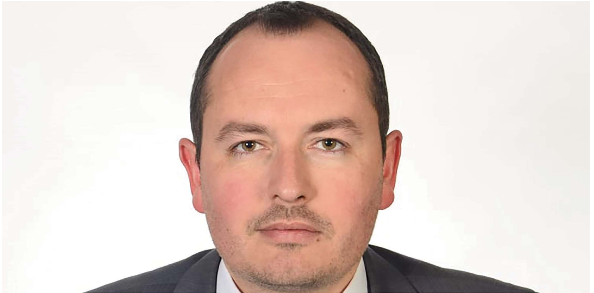
Shkruan: Elton TOTA

Dhënia e ndihmës shtetërore nga qeveritë jepet në mënyra të ndryshme dhe për qëllime të ndryshme. Këto qëllime përfshijnë ndihmën për sektorët industrialë, firmat e veçanta, zhvillimin rajonal, inovacionin, investimet, zhvillimin e tregtisë, zhvillimin e biznesit të vogël dhe sektorë kyç si transporti, bujqësia dhe industri të ndryshme. Shumë prej formave të ndihmës shtetërore mund të jenë shumë të dobishme duke adresuar dështimet e tregut ose duke promovuar barazi ose mundësi më të mëdha.