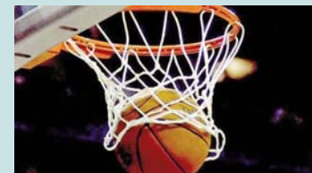
Penza (13:00), Trepça-Vëllaznimiti 13:00, Prishtina-Bashkimi (19:00).

përballje. Takimi tjetër i kësaj xhiroje është në mes të Trepçës dhe Vëllaznimit. Mitrovicaset kanë katër fitore e nëntë humbje, kurse skuadra nga Gjakova ka tri fitore dhe dhjetë humbje. Të shtunën takohen: Kastrioti-