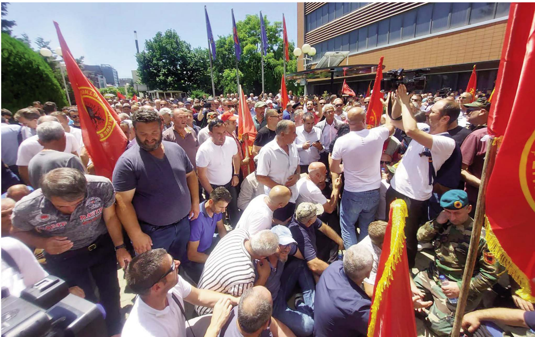
Veteranët e UÇK-së protestojnë sërish para Kuvendit të Kosovës