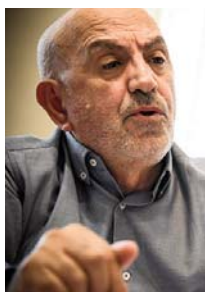
Shkruan: Behxhet Sh. SHALA - BAJGORA