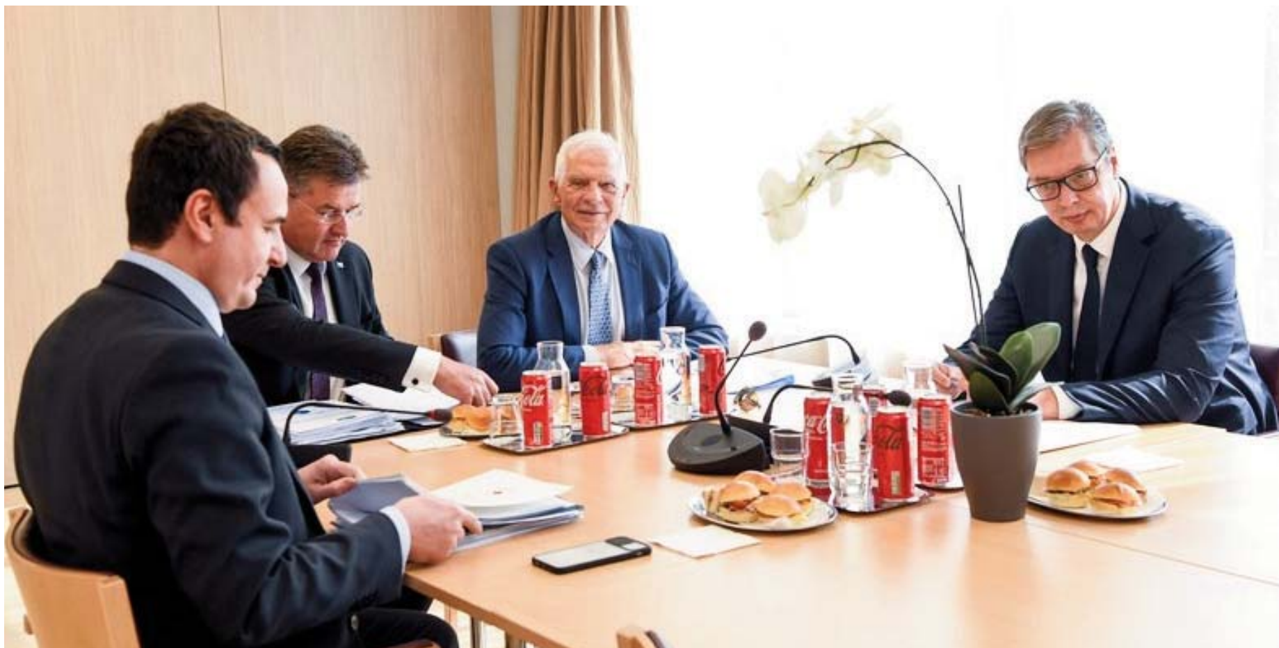
KRYEMINISTRI KURTI DHE PRESIDENTI VUÇIQ ZHVILLUAN DY RAUNDE BISEDIMESH NË BRUKSEL