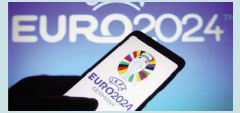
grup, short ky që nuk do të ishte i mirëpritur

lojtarët nuk guxojnë ta kundërshtojnë pushtimin që Vladimir Putini po tenton ta bëjë ndaj Ukrainës. Vlen të përmendet se Kosova dhe Shqipëria janë pjesë e këtyre kualifikimeve, të vendosura në vazone e katërt, respektivisht tre. Nga ky përcaktim i vazove, "dardanët" dhe "kuqezinjët" mund të jenë në të njëjtin