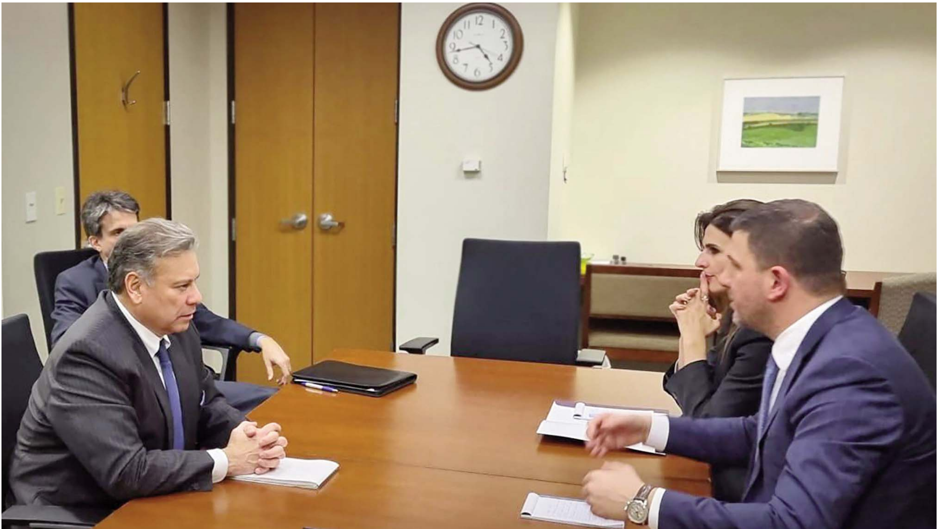
DY LIDERËT E OPOZITËS, MEMLI KRASNIQI DHE LUMIR ABDIXHIKU, VAZHDOJNË VIZITËN NË SHTETET E BASHKUARA TË AMERIKËS (SHBA)