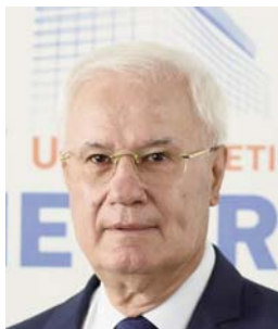
Prof. dr. Paskal MILO