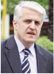
Shkruan: Pandeli MAJKO

Aksioni i braktisjes së institucioneve nga serbët në Kosovë është një aksion i organizuar nga Beogradi zyrtar. Konflikti shqiptaro-serb ka cilësinë e pandryshueshme në të cilën serbët sillen si viktima dhe shqiptarët, në fund, numërojnë jetët e humbura nga radhët e tyre.