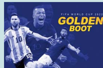
portugezin Goncalo Ramos që kanë shënuar nga tre gola.

pesë gola, i ndjekur nga Lionel Messi i Argjentinës me katër gola, kurse i treti, po ashtu me katër gola, është sulmuesi tjetër i 'Gjelave', Olivier Giroud. Toppesësja kompletohet me spanjollin Alvaro Morata dhe