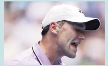
ndërsa çekja Karolina Pliskova fitoi 2-0 ndaj kazakes Putinseva.