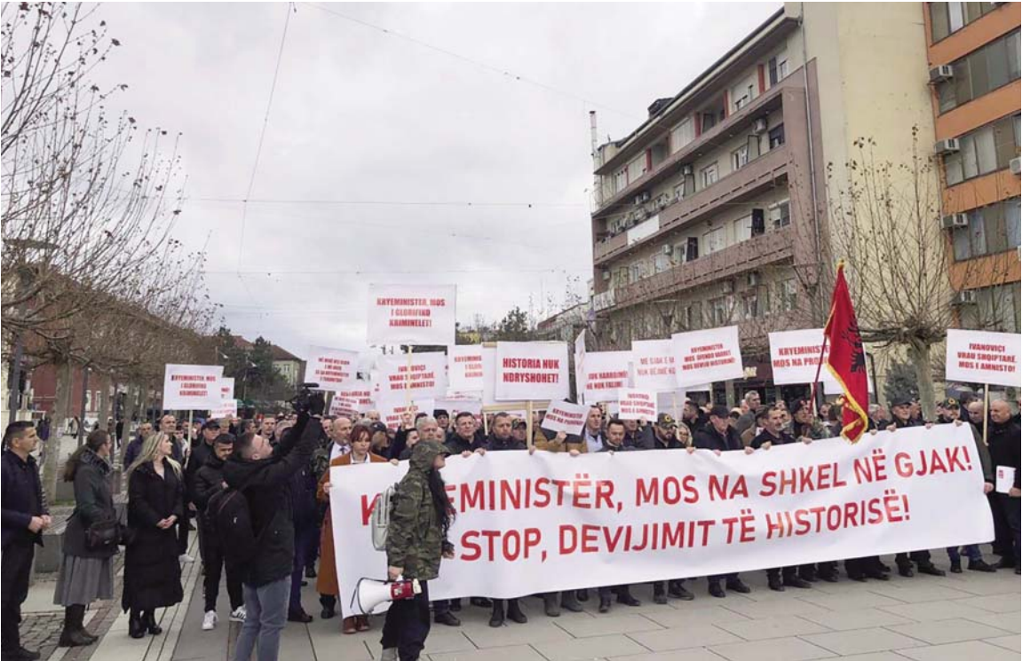
MBAHET PROTESTA "KRYEMINISTËR, MOS NA SHKEL NË GJAK! STOP DEVIJIMIT TË HISTORISË"