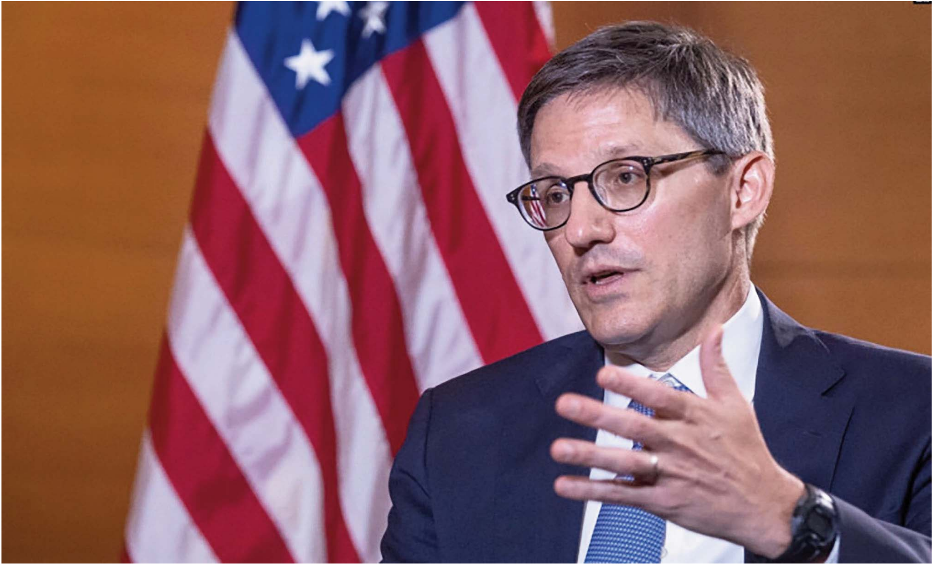
KËSHILLTARI I LARTË I DEPARTAMENTIT AMERIKAN TË SHITETIT, DEREK CHOLLET, FLET PËR PROCESIN E DIALOGUT KOSOVË - SERBI