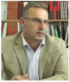
Shkruan: Faton B. MEHMETAJ

(Sllavizimi i kishave shqiptaro-bizantine të Kosovës, projekte të hershme të Serbisë)