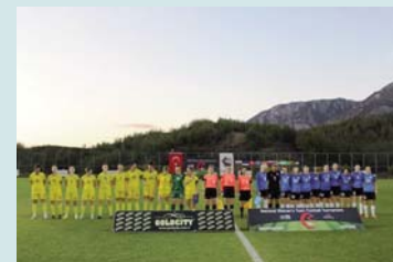
orën 11:00 sipas kohës lokale (ora 9:00 me kohë të Kosovës).

në fund të ndeshjes dardanet krijuan edhe disa raste shënimi, ndërsa Estonia, me gjithë orvatjet, nuk arriti të bëjë diçka më shumë. Kjo fitore është stimul për vashat e Kosovës për ndeshjen e radhës. Ndeshjen e dytë Kosova do ta zhvillojë më 18 shkurt kundër Honkongut në