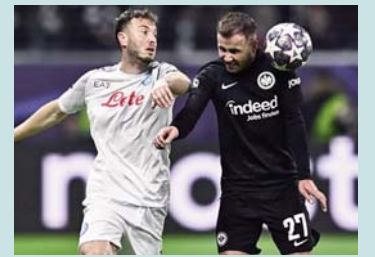
mjaft të mirë të shkojnë në çerekfinale të kësaj gare.

Napoli është lider dhe favoriti i padiskutueshëm për t'u shpallur kampion i Italisë. Gjithashtu, Rrahmani me shokë e bënë një fazë të grupeve pothuajse të përkryer në Ligën e Kampioneve, ndërsa tash janë në rrugë