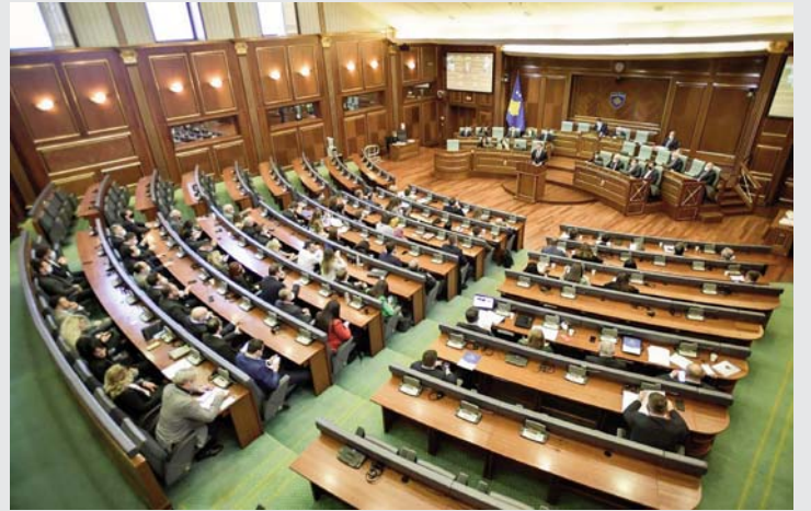
publikun rezultatet e votimit me individualisht në seancat e dorë për secilin deputet Kuvendit”, ka njoftuar KDI.

Në mënyrë që të rritet transparencja dhe llogaridhënia e Kuvendit dhe e deputetëve individualisht, KDI-ja kërkon nga Kuvendi që në një afat sa më të shpejtë të mundshëm ta rikthejë votimin elektronik. “Në ndërkohë, Kuvendi, përveç publikimit të votave kumulative, duhet t’i bëjë të qasshme për