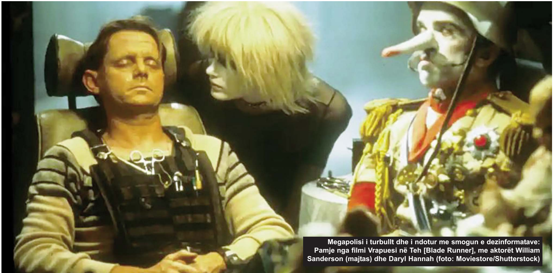
Megapolisi i turbullt dhe i ndotur me smogun e dezinformatave: Pamje nga filmi Vrapuesi në Teh [Blade Runner], me aktorët William Sanderson (majtas) dhe Daryl Hannah