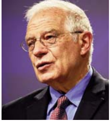
Nga Josep BORRELL

24 shkurti 2022 do të kujtohet përgjithmonë si dita kur Rusia filloi pushtimin e saj brutal, të paprovokuar dhe të paligjshëm të Ukrainës. Ky ishte dhe mbetet një rast agresioni i pastër dhe një shkelje e qartë e Kartës së OKB-së. Kjo luftë nuk është as 'vetëm një çështje evropiane', as nuk ka të bëjë me 'Perëndimi kundër pjesës tjetër'. Ajo ka të bëjë me llojin e botës në të cilën të gjithë ne duam të jetojmë: askush nuk është i sigurt në një botë ku përdorimi i paligjshëm i forcës nga një fuqi bërthamore dhe anëtare e përhershme e Këshillit të Sigurimit do të "normalizohet" deri diku. Kjo është arsyeja pse e drejta ndërkombëtare duhet të zbatohet kudo për t'i mbrojtur të gjithë nga politikën e pushtetit, shantazhet dhe sulmet ushtarake.