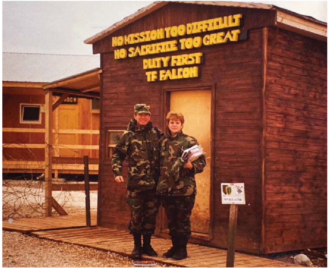
10 Maj 2000 Sojevë /Kosovë, tani në punë së bashku me Shahadijen në Njësinë e Jurispodencës së Armatës Amerikane "JAG" në kampin "Bondsteel".

Në mes të datave 05 deri 07-06-1999 forcat serbe po sulmojnë ashpër mbi forcat tona. Gjatë tre ditëve të fundit forcat tona ishin shumë aktive në regionin e Dukagjinit dhe Pashtrikut, ku i mbrojtëm me shumë sukses pozicionet tona.