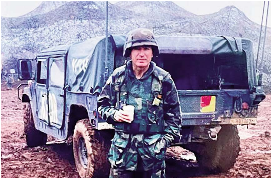
20 Qershor 2000, Sojevë /Kosovë, Ajaz Emini me Gjeneralin e UÇK's Agim Cekun