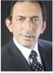
Shkruan: Blerim REKA

1. Pas agrarit dhe industrialit, bota po e jeton transformimin teknologjik, ku jo toka, as fabrika - por informatika, do të jenë lëvizës i progresit; e dija - fuqi. Bujqit, ishin zëvendësuar nga punëtorët (fenomeni "Ford" në SHBA, midis dy luftërave botërore); e këta të fundit nga robotet (modeli japonez i bazuar në dije, sipas Nonaka dhe Takeuchi). Post-industrializimi, post-moderna dhe post-historikja, ndërkaq dominuan diskursin e mendimit global. Pas autokracisë dhe demokracisë, në shekullin tonë po imponohet gjithnjë e më tepër një "sundim" i ri: netokracia. Nga sundimi i individit e sundimi i shumicës, po kalohet tek "sundimi" i të gjithëve, apo i