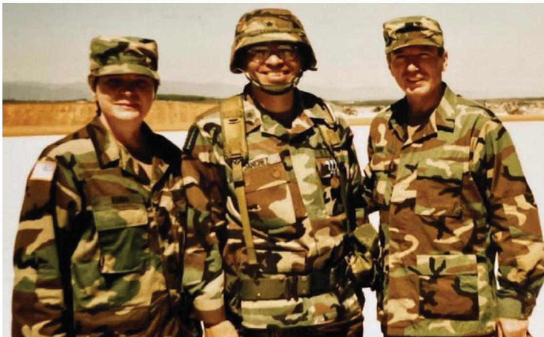
17 Qershor 1999 Sojeve /Kosovë, në këtë shtëpi kaluam natën e parë në Kosovën e Lirë me të njëjtën Njësi Speciale Amerikane nga Kukësi në Shqipëri.

Gjenerali Agim Çeku ishte një burrë në të dyzetat, i cili kishte