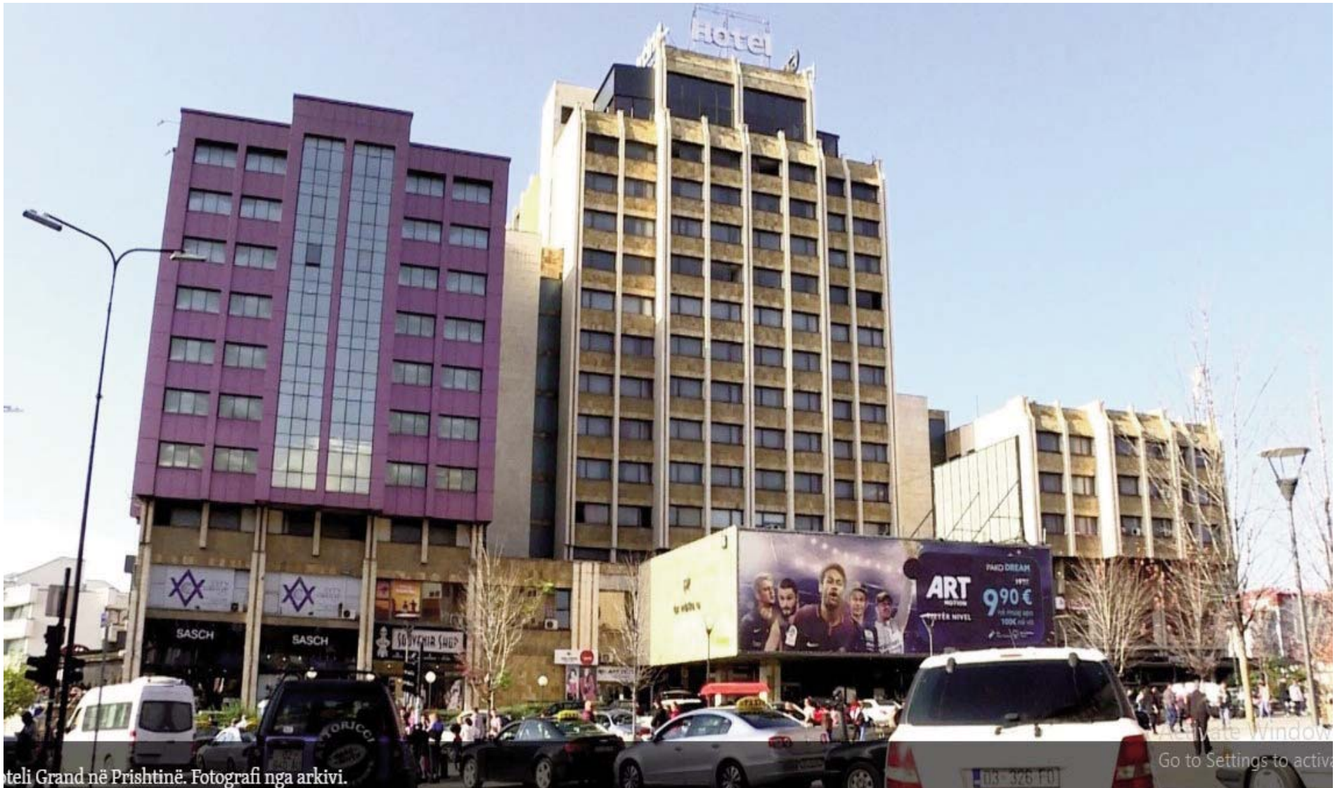
Hoteli Grand në Prishtinë. Fotografi nga arkivi.