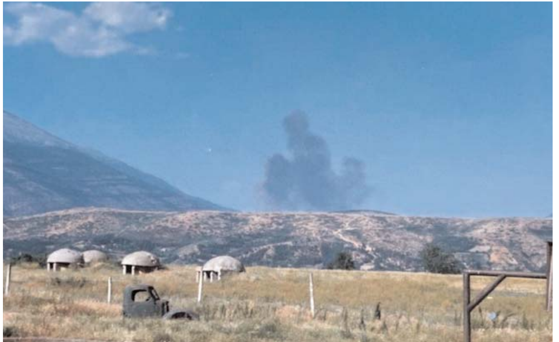
7 Qershor 1999 Foto që shkrepë diku afër kufirit Shqipëri/Kosovë, gjatë bombardimeve të B52 Amerikane / NATO's Brenda Kosove

Injejt incident kishte ndodhë edhe njëherë tjetër, për derisa po kryhej sulmi në një urë hekurudhore kalon treni dhe kapet në të njëjtën mënyrë. Sot gjithashtu ndodhi edhe një aksident me një Aeroplan AAV-8B Harrier të Marinës Amerikane i cili ra në ujërat e Adriatikut për