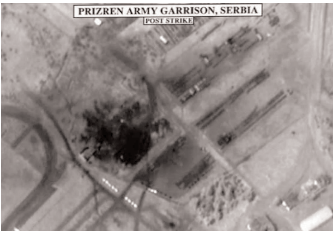
1999 Foto e Pentagonit pas bombardimit të kazermës ushtarake serbe në Prizren /Kosovë