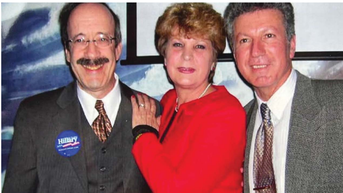
13 Shkurt 2008 Lakewood /SHBA, me mikun e madhë të shqiptarëve, Kongresmenin Amerikan Eliot Engel