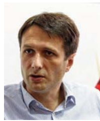
Shkruan: Valon MURATI

Sot 25 vite ka ndodhur një ndër ngjarjet më të rëndësishme për fuqizimin e luftës çlirimtare. Më 11 maj të vitit 1998 UÇK dhe LKÇK kanë arritur marrëveshjen që i tërë potenciali ushtarak i LKÇK-së të vendoset nën komandën e UÇK-së përderisa LKÇK ka mbajtur pavarësinë e saj politike. Për aq sa kjo ngjarje ka luajtur një rol të madh në ngritjen e luftës sonë në një shkallë tjetër, për aq sa ka ndikuar në rritjen e mobilizimit popullor dhe sidomos në dërgimin e mesazhit se përkundër dallimeve shqiptarët mund të bëhen bashkë në funksion të lirisë së Kosovës, për aq kjo ngjarje disi ka mbetur nën hije nga zallamahia që ka kapluar shoqërinë tonë pas luftës çlirimtare si dhe nga interesat ditore meskine politike që jo çdoherë kanë qenë të interesuara për ta vendosur këtë ngjarje në pediastalin që i takon.