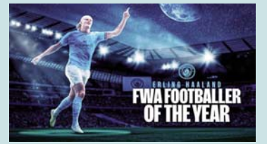
vjetorin e çmimit të parë që iu nda Sir Stanley Matthews në vitin 1948.

sondazhin e meshkujve, me mesfushorin e Cityt, Kevin De Bruyne i katërti dhe sulmuesi i Manchester Unitedit, Marcus Rashford, i pesti. Haalandi do ta marrë çmimin e tij në një darkë speciale për Futbollistin e Vitit më 25 maj, e cila do ta shënojë 75-