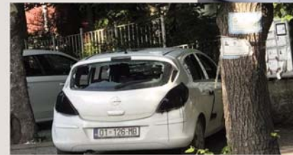
AGK - Asociacioni i Gazetarëve të Kosovës Association of Journalists of Kosovo

PRISHTINË, 30 MAJ - Asociacioni i Gazetarëve të Kosovës ka bërë me dije se gazetarët që po i përcjellin ngjarjet në veri kanë qenë cak i disa sulmeve. AGK-ja ka njoftuar se persona të maskuar kanë sulmuar gazetarë të medieve të ndryshme në Leposaviq dhe njërit medium i është thyer kamera. Po në këtë komunë gazetarët janë sulmuar edhe me gjësende të forta nga protestuesit serbë. “Në një transmetim direkt të medieve, shihen disa gra duke tentuar t’i pengojnë gazetaret e RTV Dukagjinit, Kohës dhe mediave të tjera të raportonin drejtpërdrejt nga kjo komunë”, ka njoftuar AGK-ja.