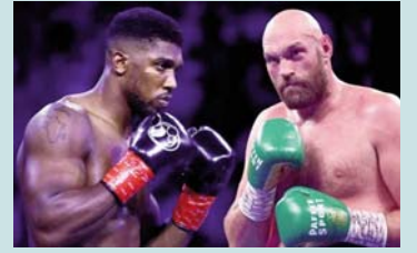
atë që mund të ishte përballja më e madhe britanike në histori.

“Wembley” në shtator, komente këto që erdhën në të njëjtën javë ku ai tregoi se dalja e tij e radhës mund të ishte në Australi kundër Demsey McKean. Në javët pasi Joshua humbi revanshin e tij me Usyk, Fury përdori platformën për t'u përpjekur të pajtohej me