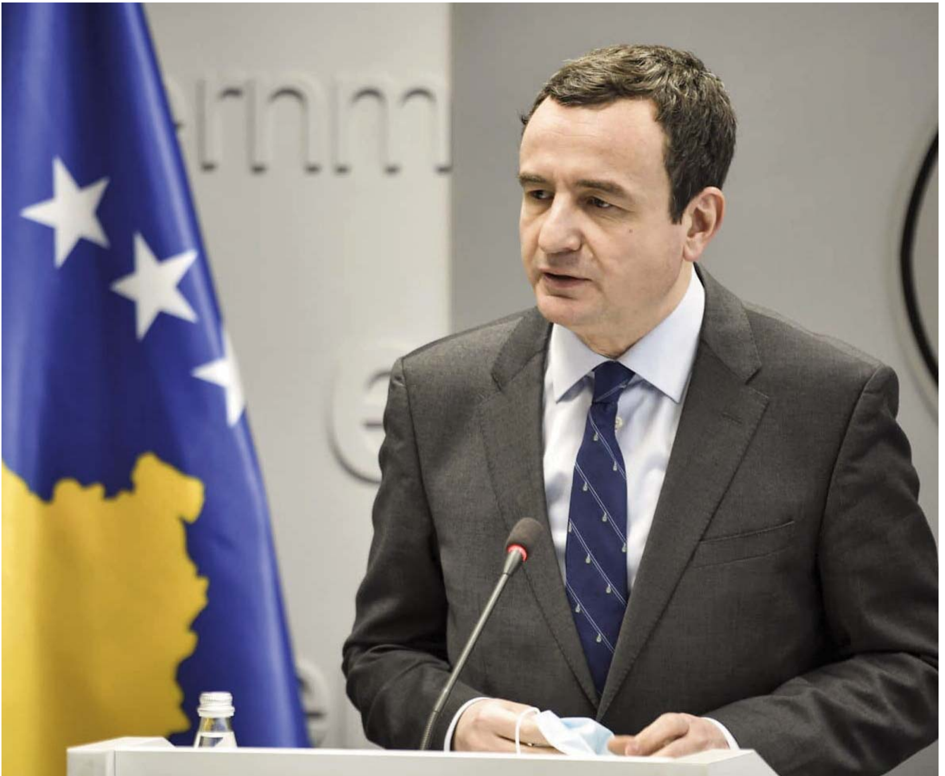
KRYEMINISTRI ALBIN KURTI MBAN KONFERENCË PËR MEDIE