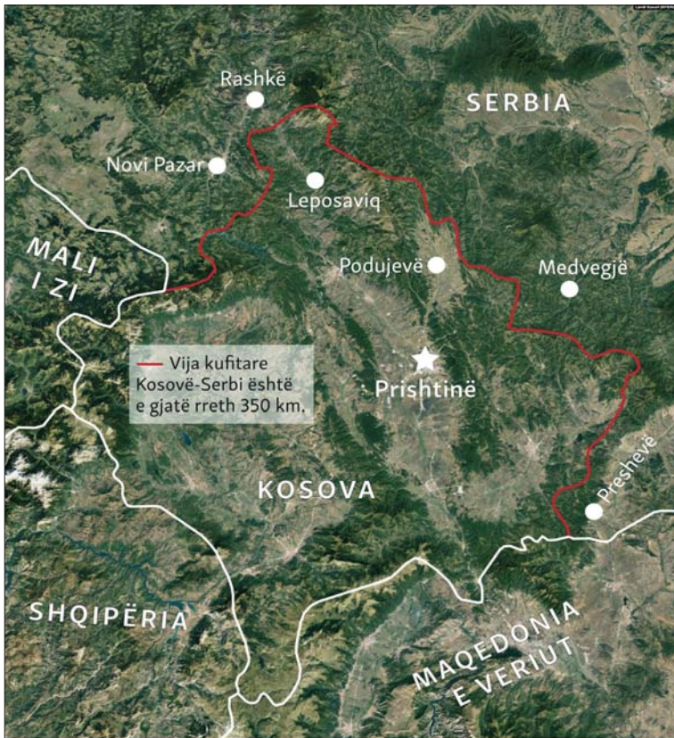
Harta: Lendi Susuri, Google Earth / Landsat / Copernicus

As KFOR-i e as autoritetet e Kosovës nuk kanë folur për REL-in lidhur me mënyrën e menaxhimit të zonës neutrale në mes të Kosovës dhe Serbisë.