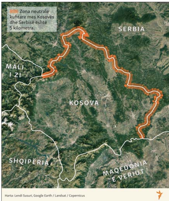
Harta: Lendi Susuri, Google Earth / Landsat / Copernicus

Dy vendet kanë arritur Marrëveshjen për Menaxhimin e Integruar të Kufirit më 2 dhjetor