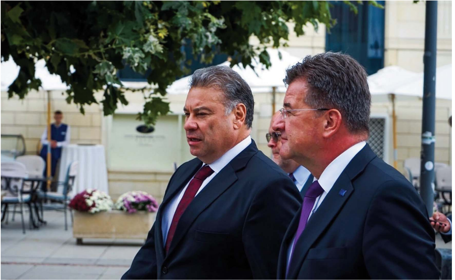
ZYRTARI I LARTË AMERIKAN, GABRIEL ESCOBAR, DHE AI I BE-SË, MIROSLAV LAJÇAK, KANË FOLUR SËRISH PËR SITUATËN NË VERI