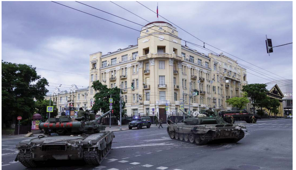
Mercenarët e Wagner i drejtojnë tanket Shtabit Qendror të Luftës në Rostov

Kur Putini vendosi në vitin 2014 të pushtonte Krimenë dhe të nxiste një kryengritje në Ukrainën lindore, Wagner – plot me ish operativë të forcave speciale nga ushtria ruse – ishte një nga instrumentet që ai përdori. Wagner nuk ishte fillimisht në ballë të pushtimit rus të Ukrainës