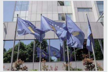
shpenzimeve është shpërndarë në kategori të tjera të shpenzimeve.

ishin 459.7 milionë euro. Pjesën më të madhe të shpenzimeve e përbëjnë: kompensimi i punëtorëve (34.5 për qind); kontributet sociale dhe përfitimet (29.0 për qind); konsumi i ndërmjetëm (12.5 për qind); subvencionet (11.6 për qind); ndërsa pjesa e mbetur e