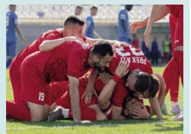
datës 13 korrik ndaj ekipit vendas Progres Niederkorn.

vazhdojnë të mbeten në lidhje kontraktuale me klubin dhe janë të regjistruar për ndeshjet kualifikuese në Ligën e Konferencës. Ekspedita e Gjilanit do të udhëtojë me 11 korrik drejt Luksemburgut, me ç'rast do t'i zhvillojë dy seanca stërvitore para ndeshjes të